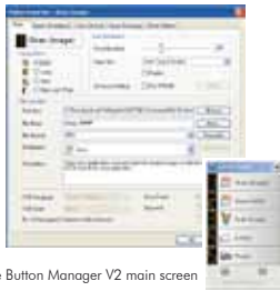
The Button Manager V2 main screen

Button Manager V2 facilita el proceso de escanear y enviar sus documentos a sus destinos favoritos con sólo presionar un botón. La nueva versión viene con una innovadora característica que le permite escanear y enviar automáticamente el archivo a servicios populares como Google Docs, Microsoft SharePoint, o a un FTP. Además, iScan permite insertar la imagen escaneada o el texto reconocido (con un proceso OCR opcional) en su editor de texto preferido, como Microsoft Word para optimizar su flujo de trabajo.