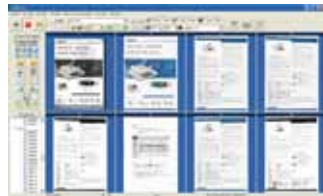
The AvScan 5.0 main screen

-La Herramienta inteligente para el manejo de sus escaneos