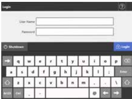
Pantalla de apertura de sesión

Cada vez que se pone en marcha el N7100 se genera una clave de cifrado para la encriptación de los ficheros que se quedan en la memoria antes de ser enviados a su destino final. Cuando la información llega a su destino, esos ficheros son eliminados de la memoria de forma que no hay posibilidad alguna de que los datos sean interceptados.