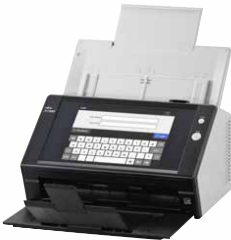
A4 vertical a 300 ppp 25 ppm / 50 ipm Digitalice lotes mezclados mediante el alimentador de 50 hojas