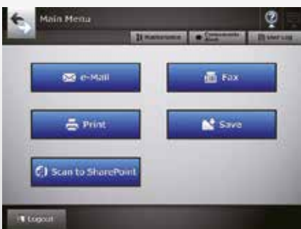
Pantalla de menú principal