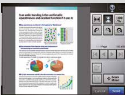
Pantalla de previsualización (Visor de escaneado)